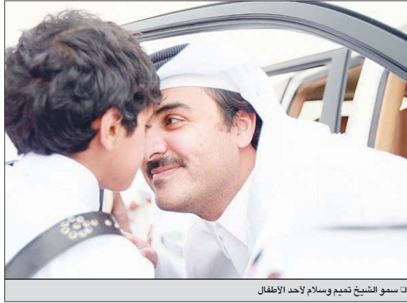
□ سمو الشيخ تميم وسلام لأحد الأبطال